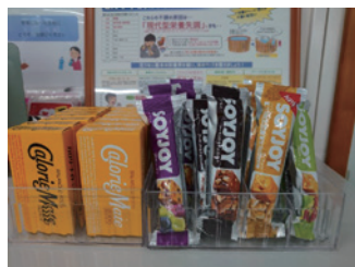
朝食欠食を減らすため、カロリーメイトやソイジョイが用意されています。