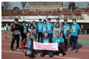
「かるがもマラソン」に参加しました。

えー、会社のせいなわけ？と思って、そこからはもう、「これから健康については口出しするから！」と宣言し、毎年9月に健康セミナーを開催しています。