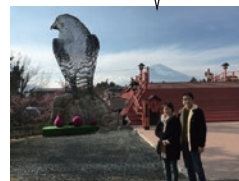
一富士二鷹三茄子