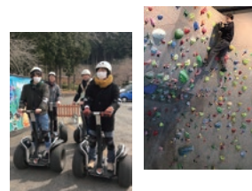
スーパー花粉症の嫁と娘