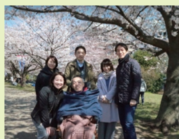
スタッフみなさんでお花見しました！

丸山へのメッセージはこちらからお願いします info@triplanning.jp