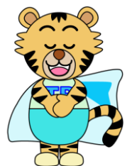
トライプランニング イメージキャラクター 『ていびとらんくん』