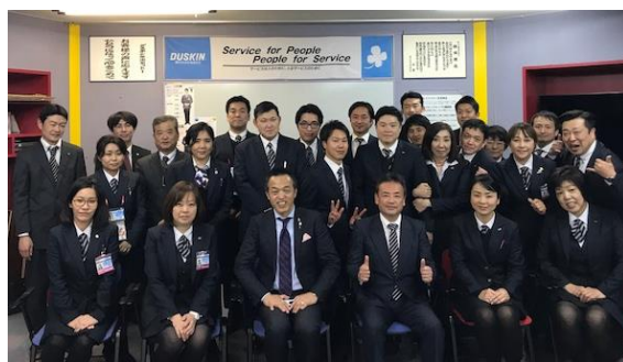
↑ 研修後の集合写真

弊社では主に、リーダー研修・幹部研修など人材育成面でのお手伝いをさせていただいております。先日も リーダー研修 を終えられたばかり。社内では『丸山塾一期生』『二期生』等々自称され、皆様研修後の成果を発揮されています。