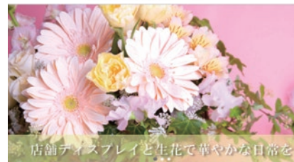
店舗ディスプレイと生花で華やかな日常を